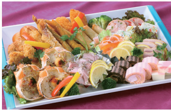
オードブル (洋) 3人前 ★5,400円(税込)