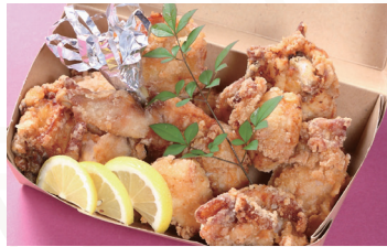
若鶏唐揚げ (2人前) ★1,620円(税込)