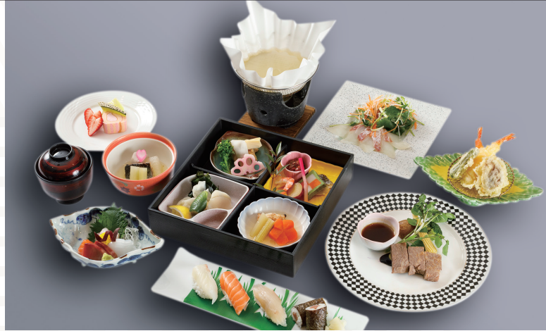
松花堂御膳 (松) 8,800円 (税込) ※食後のコーヒーサービス