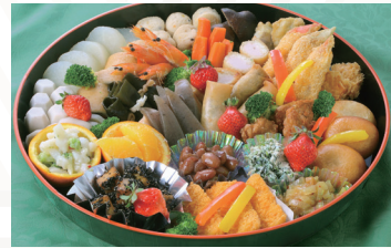
オードブル (和) 3人前 ★5,400円(税込)