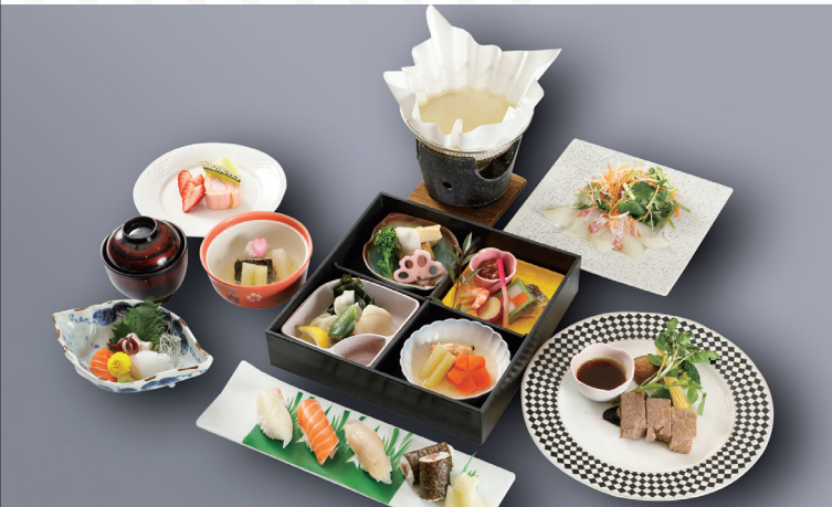
松花堂御膳 (竹) 7,700円 (税込) ※食後のコーヒーサービス