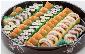
助六+細巻 6人前 ★6,480円(税込)