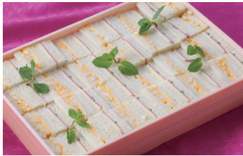
サンドイッチ 5人前 ★4,320円(税込)