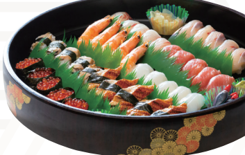
特上にぎり寿司 5人前 ★10,800円(税込)