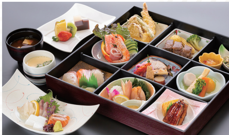
松花堂 7,150円 (税込)