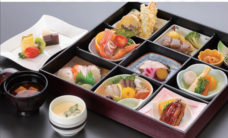
松花堂 6,050円 (税込)