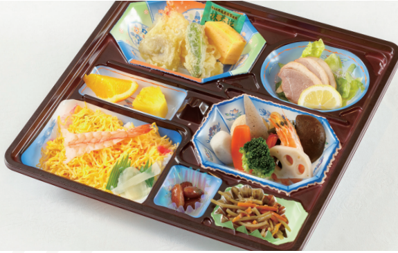
折詰「すみれ」 ★2,700円(税込)