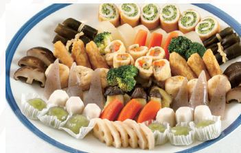
煮物盛合わせ 6人前 ★5,400円(税込)