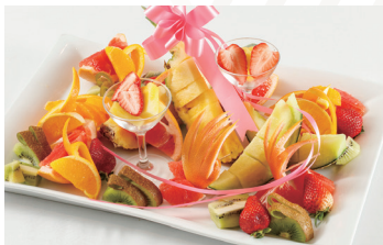
フルーツ盛合わせ 5人前 ★5,400円(税込)