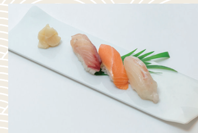
にぎり寿司(3貫) 880 (税込) 円