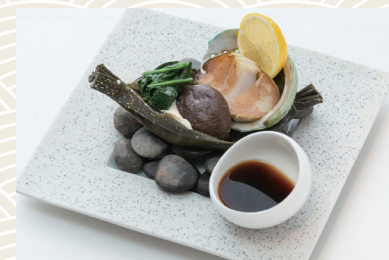
鮑舟昆布蒸し 2,200 (税込) 円