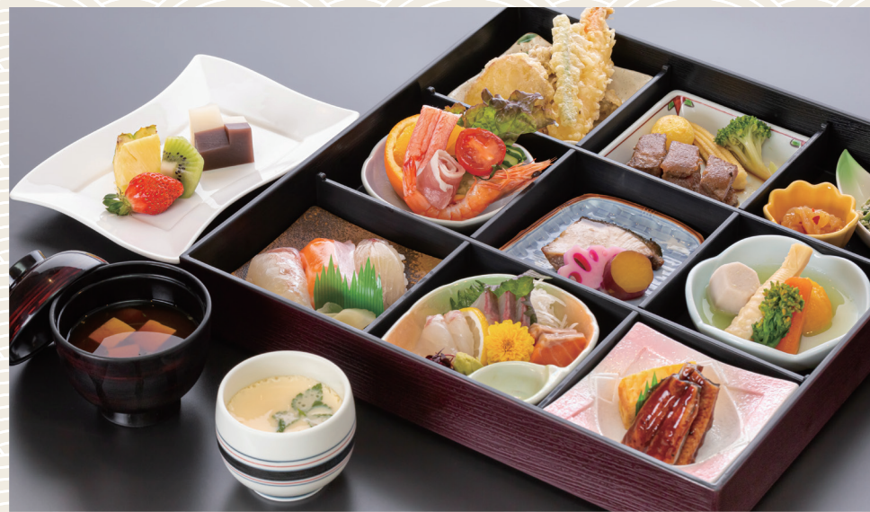
松花堂弁当 6,050 (税込) 円