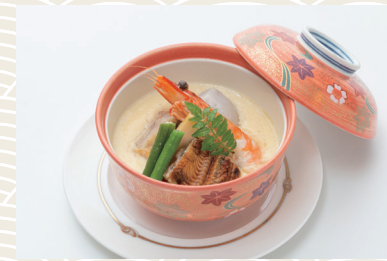
二身茶碗蒸し 880 (税込) 円 (うなぎ・海老・椎茸・鶏・銀杏・三ツ葉)