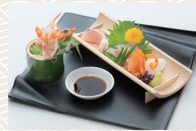
お刺身グレードアップ プラス1,100 (税込) 円(6点盛)

※季節により内容が変更になる場合がございます。※ドリンク代、およびサービス料別途(10%) ※料理・飲物のお持込、お持ち帰りはご遠慮頂いております。※アレルギーをお持ちの方は事前にお知らせ下さいませ。