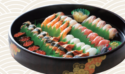
特上にぎり寿司 5人前 ★10,800円(税込)

※佐世保市内及び近郊(離島を除く)に無料配達いたします。 ※お届け日3日前までにご注文下さい。 ※旬の食材で調製いたしておりますので、一部献立が変更になる場合がございます。