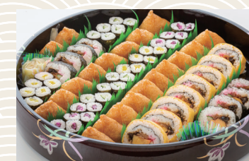
助六+細巻 6人前 ★6,480円(税込)