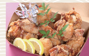
若鶏唐揚げ (2人前) ★1,620円(税込)