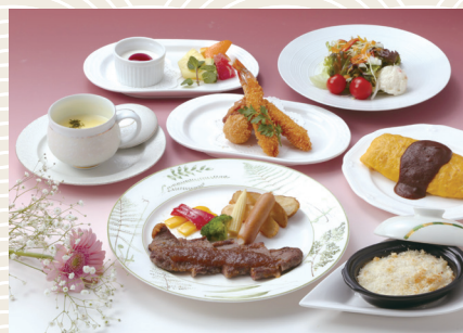
お子様コースA 3,300 (税込) 円