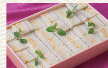
サンドイッチ 5人前 ★4,320円(税込)