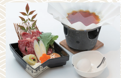
国産牛ロースすき鍋 (生たまご付) 3,300 (税込) 円