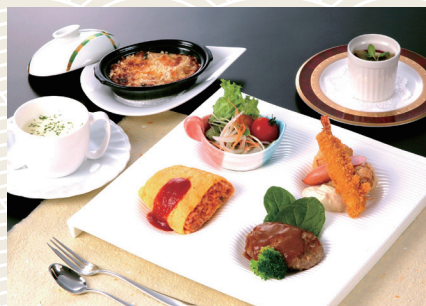
お子様コースB 1,650 (税込) 円