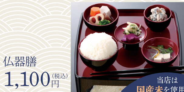
仏器膳 1,100 (税込) 円