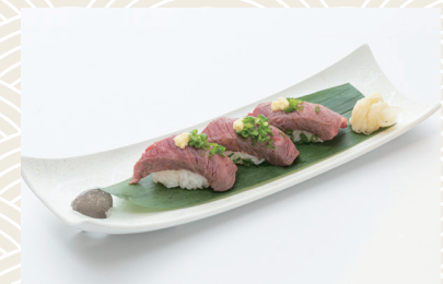
国産牛握り寿司 1,980 (税込) 円