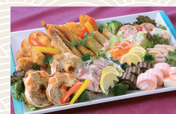
オードブル(洋) 3人前 ★5,400円～(税込)