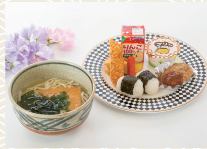
幼児コース 1,100 (税込) 円