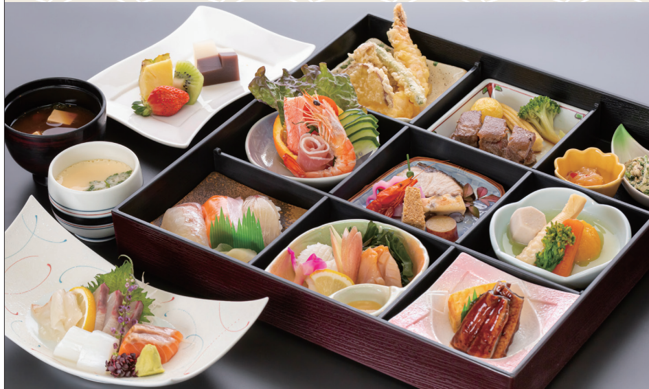
松花堂弁当 7,150 (税込) 円