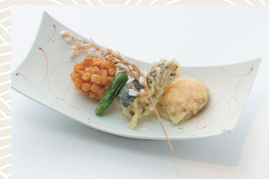
季節の揚物 1,100 (税込) 円