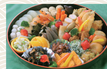
オードブル(和) 3人前 ★5,400円～(税込)