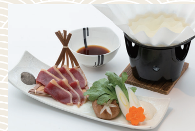
鴨鍋 1,760 (税込) 円